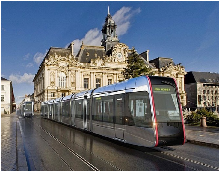
Le futur Tramway, Place Jean-Jaurès

Le tablier métallique du nouveau pont sur le Cher, construit pour le passage du tramway à Tours, relie les deux rives depuis le 10 novembre. Le chantier sera bouclé en avril. D'une longueur de 225m sur 13m de large, ce pont supportera le passage du tramway, des bus, des vélos et des piétons. Sa structure sera peinte en bleu car c'est la couleur de la ville de Tours depuis des siècles, a justifié Jean Germain, maire de Tours. L'élu a également profité de son temps de parole vis à vis des opposants au tramway, balayés pour l'instant sur le terrain judiciaire. L'action menée par un géographe tourangeau ( débouté en référé) devant le tribunal administratif d'Orléans contre la construction de ce nouveau pont sur le Cher n'inquiète pas Jean Germain. (Extrait d'un article NR du 11/11/2011)